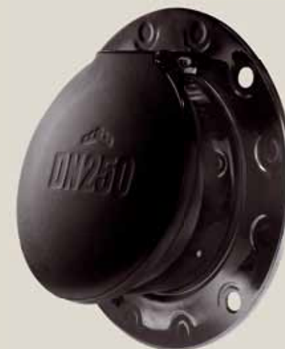
ZETEC Multi NB