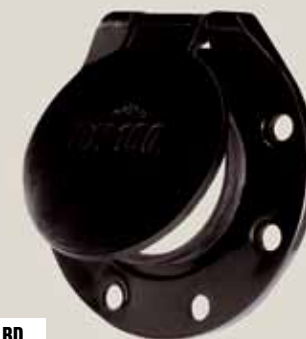
ZETEC Multi BD