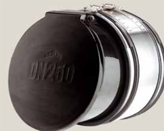
ZETEC Multi N